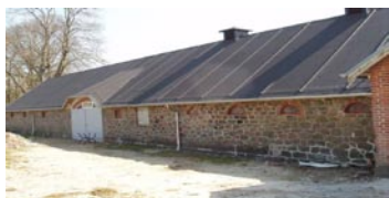
Mellem Kragelund og Nørhoved

Kragelund gl. præstegård, Sinding Hede- vej 2, Kragelund, 8600 Silke- borg, tlf. 86 86 72 11 36 senge (købmand i byen)