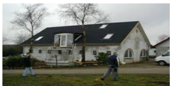
Mellem Nørhoved og Nør- relide

Nørhoved Hærvejens Bondegårdsferie Nørhovedvej 16, 8766 Nr. Snede Tlf. 75 77 10 25 og 20 48 80 25 40 senge – salg af madvarer