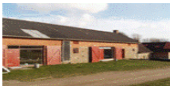
Mellem Hald og Kragelund

Hald Hovedgård Naturskolen v.Hald Ravnsbjergvej 710 8800 Viborg, tlf. 86 63 85 00 36 senge